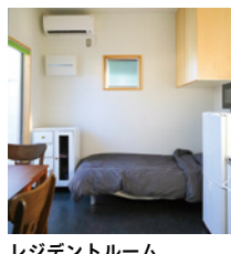
レジデントルーム