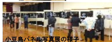
小豆島パネル写真展の様子